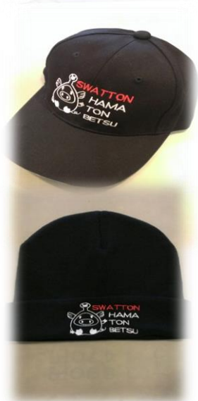
キャップ・ニット帽